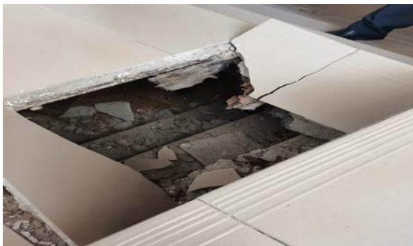
5 楼转栋之间楼梯地板砖塌陷