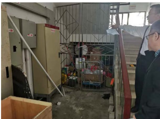
物电学院一楼楼梯口